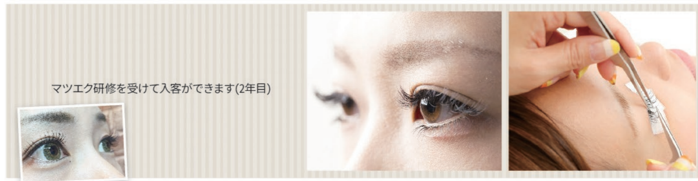
まつエク研修を受けて入客ができます(2年目)